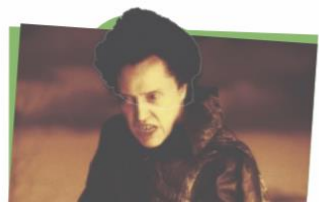
Sleepy Hollow, Tim Burton, 1999

Possible summary of the story from Sleepy Hollow trailer: