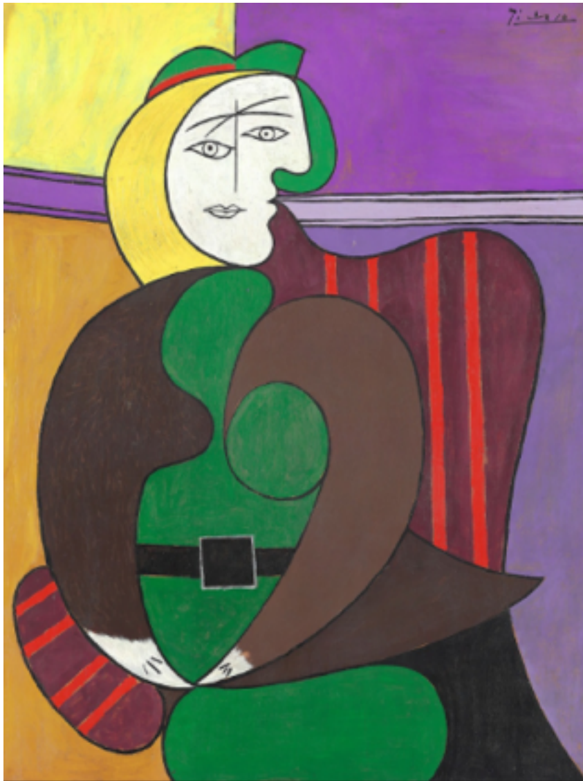
El sillón rojo (1931).