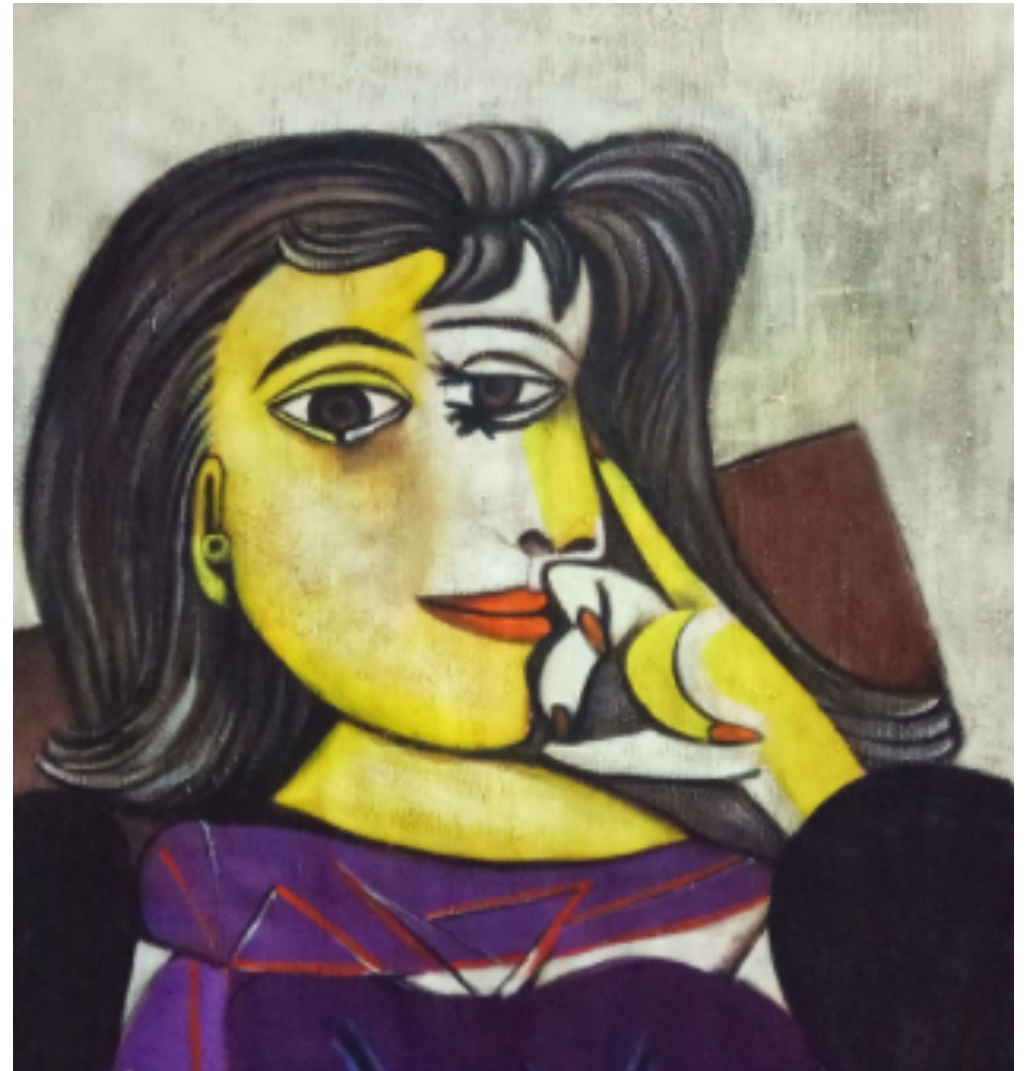
Retrato de Dora Maar, 1937