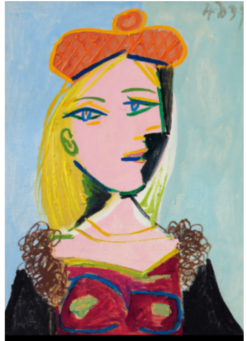
Mujer con boina naranja y cuello de piel (1937).