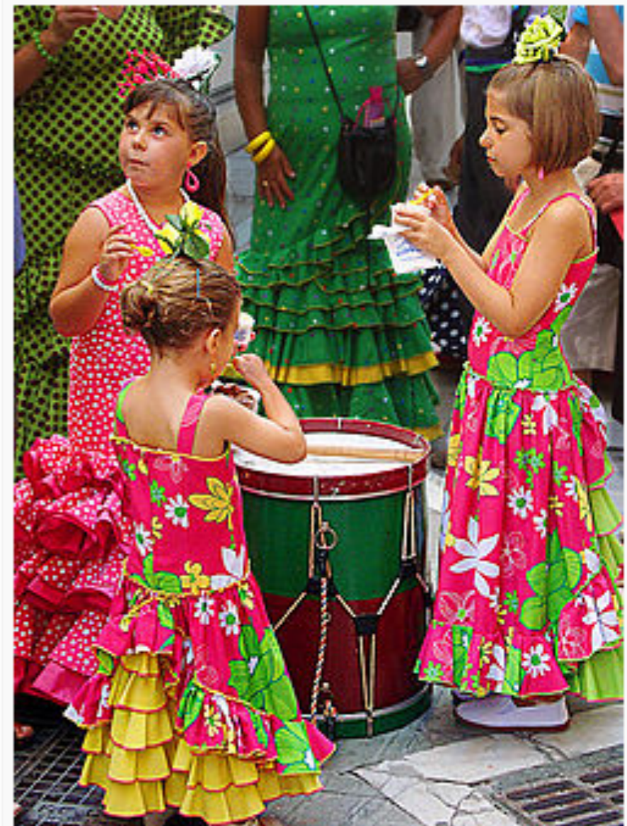
Grupito de niñas ataviadas con los trajes típicos durante la celebración de la Feria de Málaga 2008