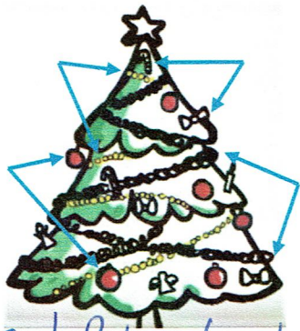
El árbol de Navidad

los Reyes Magos – el turrón – los villancicos – papá Noel – la figura - el belén – las bolas – el haba – los regalos – los adornos – las doce uvas – las guirnaldas – las luces – el roscón de reyes – el árbol de Navidad