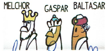
los Reyes Magos