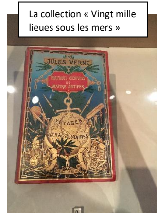
La collection « Vingt mille lieues sous les mers »

Le personnage principal à bord du « Nautilus » dans « Vingt mille lieues sous les mers » s'appelle Némo.