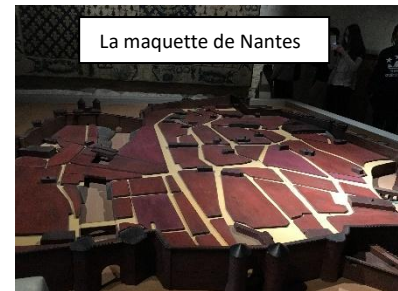
La maquette de Nantes