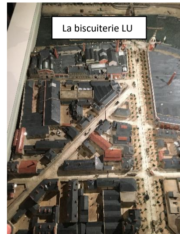
La biscuiterie LU