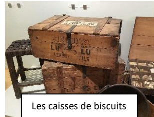
Les caisses de biscuits

Cette entreprise fabrique journallement 15 tonnes de biscuits dont 10 tonnes de « Petit Beurre ».