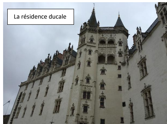
La résidence ducale

Anne de Bretagne meurt le 9 janvier 1514 au château de Blois après avoir effectué un tour de Bretagne pour affirmer sa souveraineté sur le Duché.