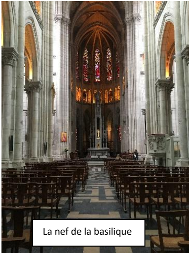
La nef de la basilique