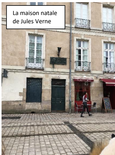
La maison natale de Jules Verne

Après avoir savouré, sous le soleil, le pique-nique préparé par l'auberge, le car nous a transportés dans les vieux quartiers de Nantes.