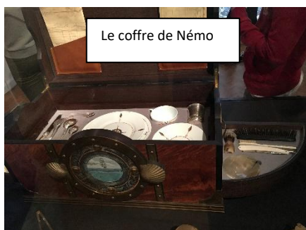
Le coffre de Némo

Cette exposition est dédiée au capitaine Némo alias Dakkar.