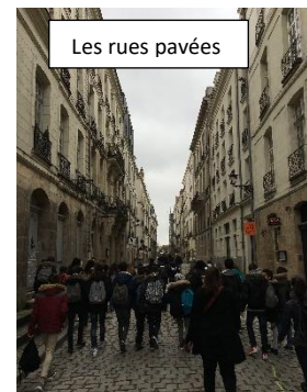
Les rues pavées

délice un chocolat chaud de chez Starbucks.