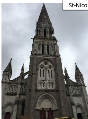
La basilique St-Nicolas

Nous avons deux objectifs : photographier la basilique Saint-Nicolas et la fresque de Jules Verne. Ce que nous avons fait après notre pause chocolat chaud. Nous en avons profité pour visiter l'intérieur de la basilique.