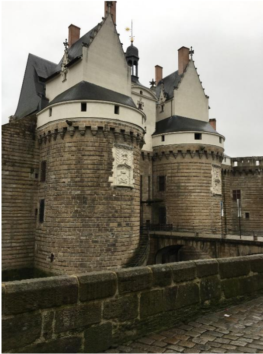
L'entrée du château