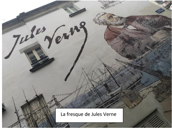
La fresque de Jules Verne

Nous sommes retournés à l'auberge vers 17H30.