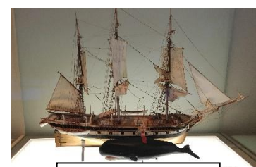
La pêche à la baleine