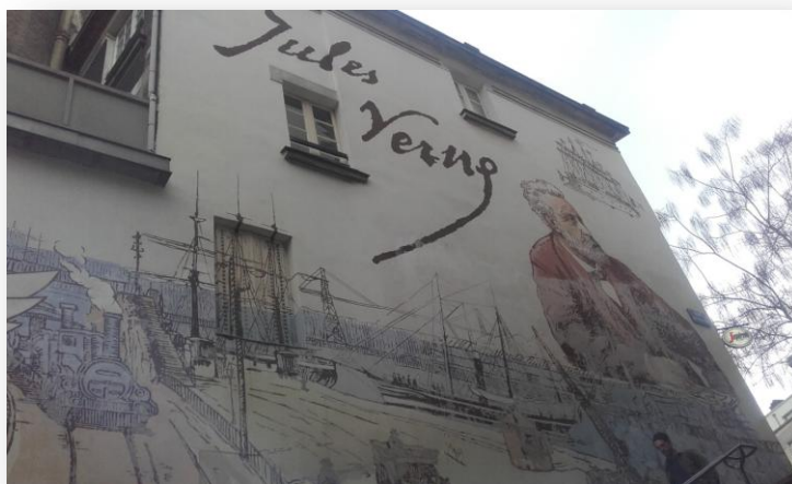
FRESQUE DE JULES VERNE DANS LES RUES DE NANTES

Pour rentrer au bus, nous avons emprunté la galerie marchande. Celle-ci servait, dans le temps, de passage pour aller au théâtre pour les personnes les plus aisées.