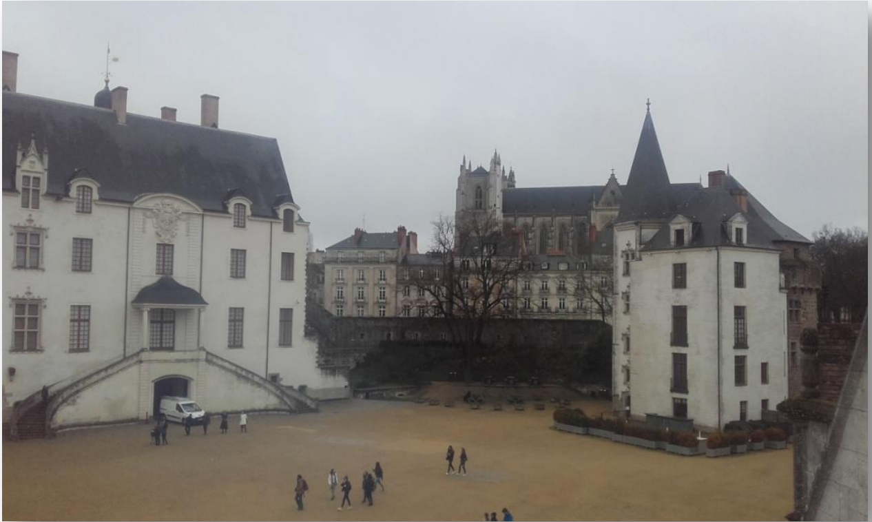
PHOTO MONTRANT LA COUR INTERIEURE DU CHATEAU

Le 2ème jour, nous avons visité le château d'Anne de Bretagne. La guide nous a expliqué : qui était Anne de Bretagne ; ce qu'elle a fait ; mais aussi l'histoire de cette bâtisse ornée de cheminées et de Nantes avec le commerce.