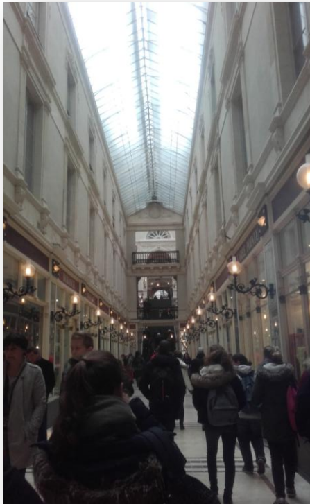
GALERIE MARCHANDE MENANT AU THEATRE

Pour rentrer au bus, nous avons emprunté la galerie marchande. Celle-ci servait, dans le temps, de passage pour aller au théâtre pour les personnes les plus aisées.