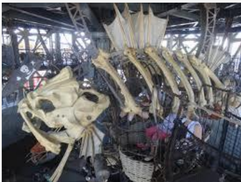
MACHINE SUR LAQUELLE J'AI FAIT UN TOUR DE CARROUSEL

Les soirées étaient aussi agréables car on ne se retrouve pratiquement jamais tous ensemble le soir, à rigoler ou à jouer.