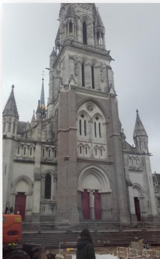
CATHEDRALE ST NICOLAS