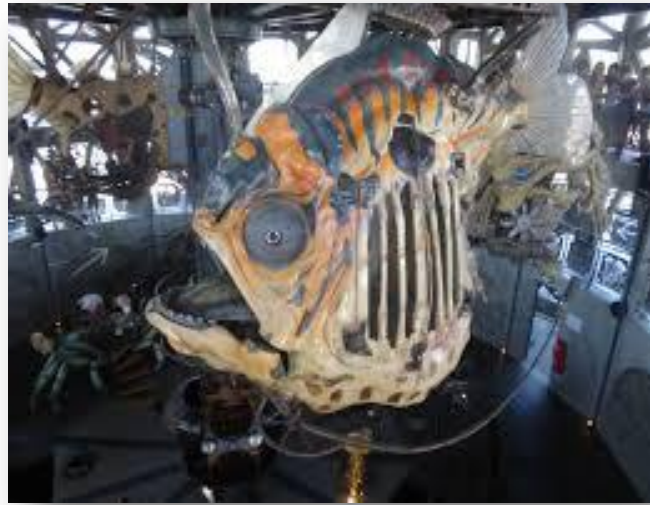
MACHINE ORIGINALE FAISANT PARTIE DU CARROUSEL

Dans le carrousel, il y avait diverses machines que Jules Verne a inventées dans un de ses livres, 20 mille lieues sous les mers . Elles étaient toutes plus originales et extravagantes les unes que les autres tel un éléphant avec une queue de girafe, original non ?