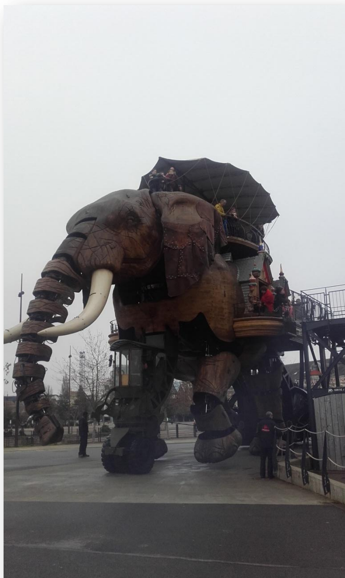
L'ÉLEPHANT EN ACTION

Nous avons pu voir l'éléphant marcher mais celui-ci ne marche pas tout seul ; il est guidé par un employé qui se trouve dans la cabine, située à l'avant de l'éléphant. Ses pattes, ses oreilles, sa queue et son corps étaient immenses.