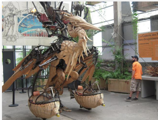
MACHINE QUI COMPOSERA L'ARBRE AUX HERONS

Ensuite, nous avons visité une sorte d'entrepôt, où l'on peut voir des machines qui vont servir à réaliser l'arbre aux Hérons (un projet en voie de construction). Elles sont exposées là pour les montrer au public avant que le projet ne soit totalement terminé. Nous avons pu voir plusieurs machines fonctionner comme l'araignée ou bien la chenille et plein d'autres machines aussi originales !