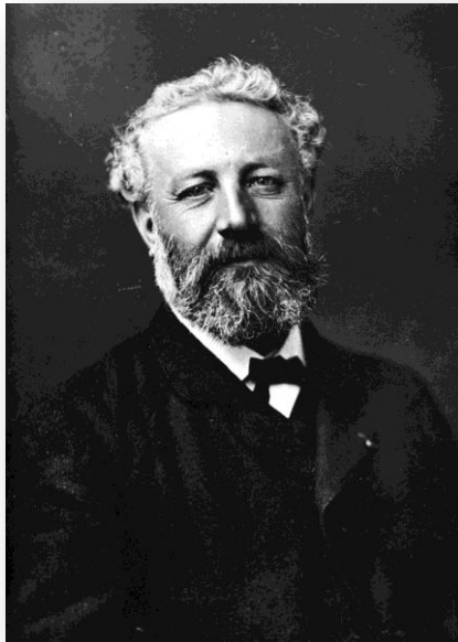
PORTRAIT DE JULES VERNE

Le 3ème jour, nous avons visité le musée de Jules Verne. C'était un visionnaire. Nous avons pu voir des textes écrits de sa main, une partie de son salon (mobilier, vaisselle...). Il a écrit sa 1 ère lettre à 8 ans avec de la plume d'oie et de l'encre de Chine. Son 1 er roman fut édité alors qu'il avait 19 ans. En 1848, il part à Paris faire des études de droits.