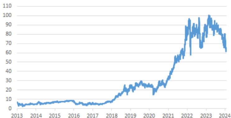
Évolution du prix du quota d'émission sur le marché européen du carbone (en euros par tonne de CO 2 )