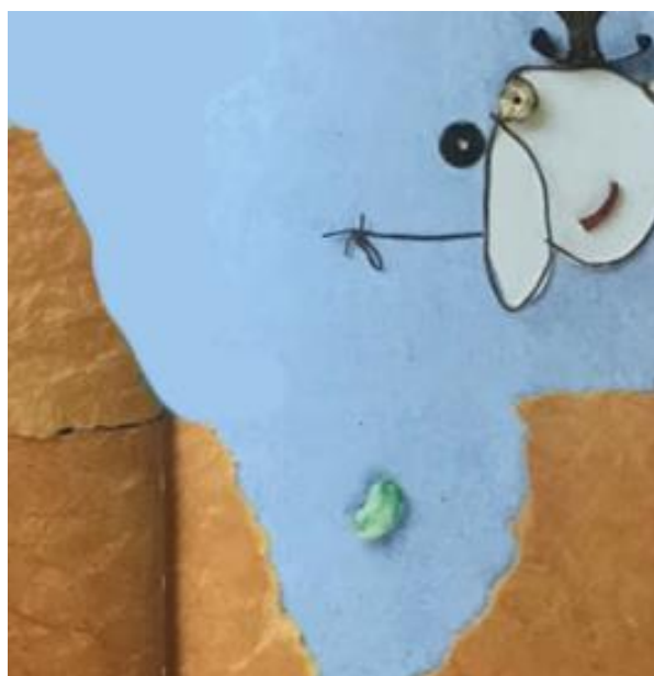
Planter la graine dans le trou