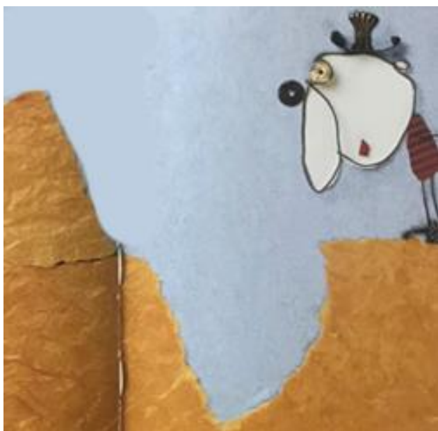
Creuser un trou dans la terre