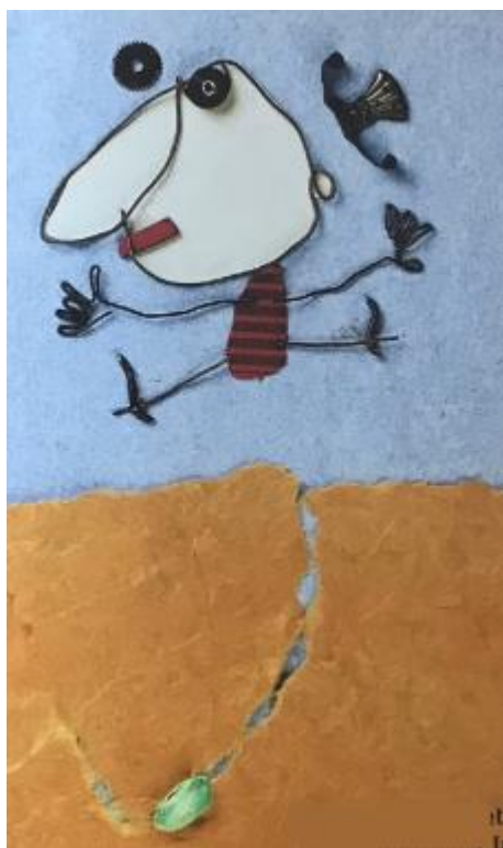
Tasser la terre en sautant ou en appuyant fort avec ses mains