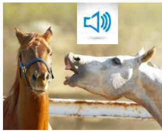
HENNISSEMENT DE CHEVAL hennissement de cheval