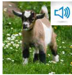
BÊLEMENT DE CHÈVRE bêlement de chèvre