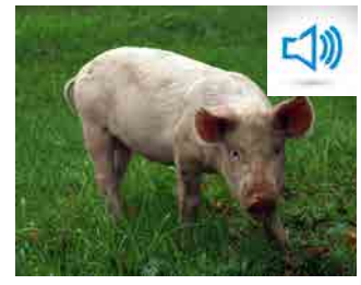
GROGNEMENT DU COCHON grognement du cochon