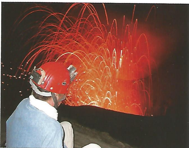
e Projections volcaniques aux îles Vanuatu, en 2005.