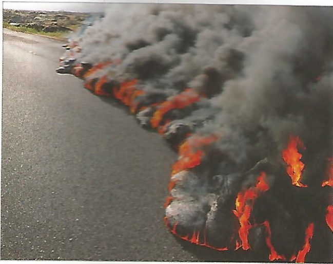
a Coulée de lave à Hawaï.