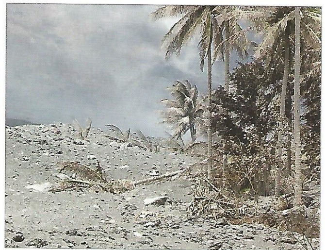
f Bombes volcaniques aux Philippines.