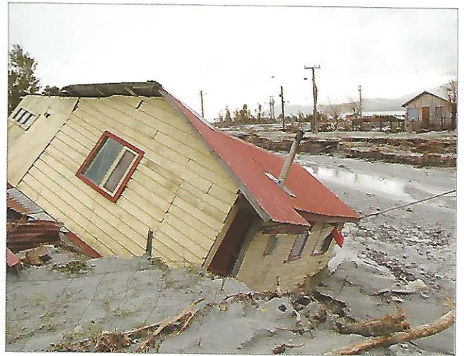
b Coulée de boues au Chili, en juin 2008.