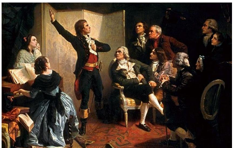
Rouget de Lisle chantant la Marseillaise (ou plutôt le Chant de guerre pour l'armée du Rhin... ) pour la première fois :

C'est la III ème République qui en fait un hymne national en 1879.