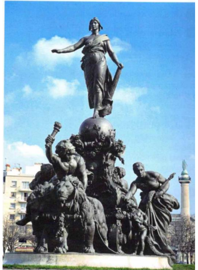
Jules Dalou, Le Triomphe de la République, 1899.

Certains partisans de la Révolution française, les « sans-culottes », portaient eux aussi ce bonnet.