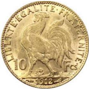
Pièce de 10 francs en or datant de 1912.

Pendant l'Antiquité on ne parlait pas de "Français". Ceux qui habitaient ici étaient appelés les "Gaulois". Or en latin "gallus" veut dire à la fois "coq" et à la fois "gaulois".