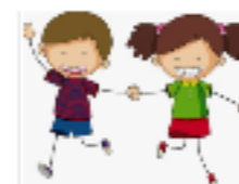
2 enfants isolés