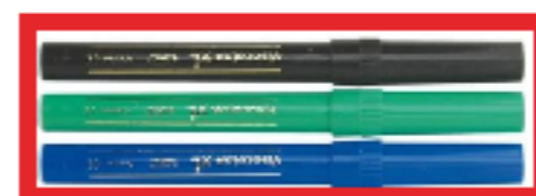
1 étui de 3 feutres