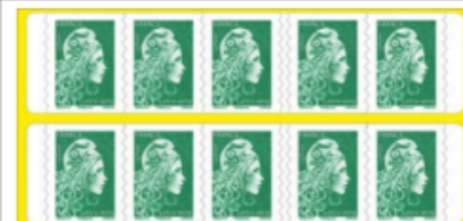
1 carnet de 10 timbres.