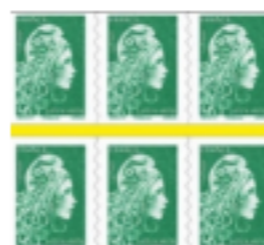
6 timbres isolés