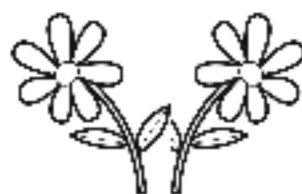
2 fleurs isolées