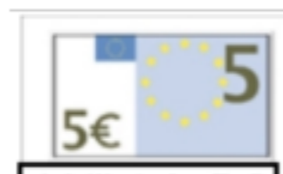
1 billet de 5 €