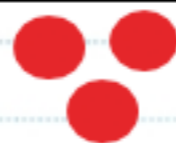
3 billes isolées