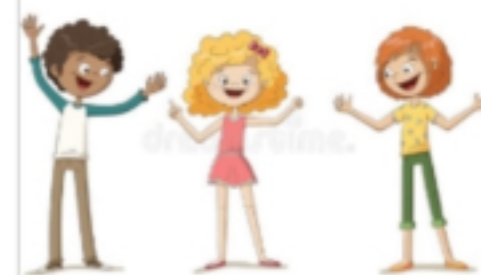
1 équipe de 3 enfants.