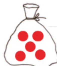
1 sac de 5 billes