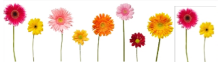
1 bouquet de 10 fleurs