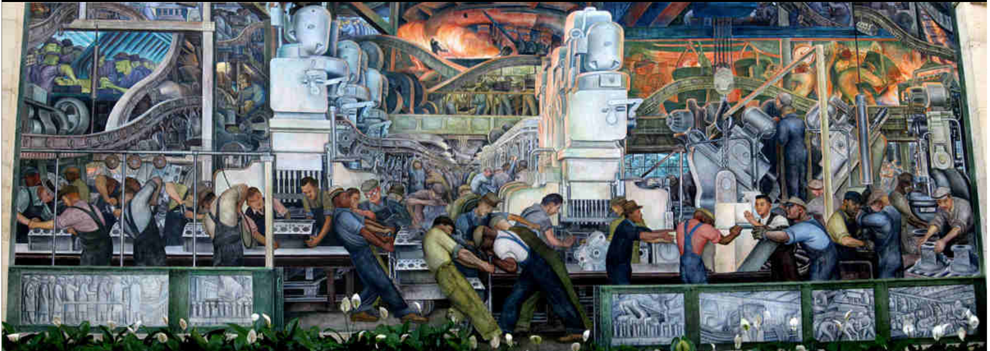
« Detroit Industry », 1932-1933, Detroit Institute of Art