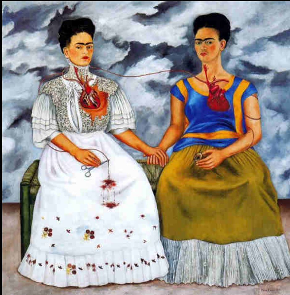
« Les Deux Fridas », 1939, peinture à huile, 1,73 x 1,73m