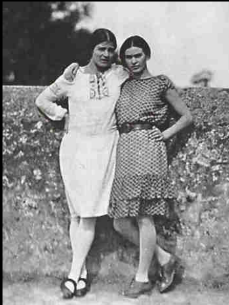
Frida Kahlo et Tina Modotti

« La distribution des armes », 1928, Museo Dolorès Olmedo, Mexico