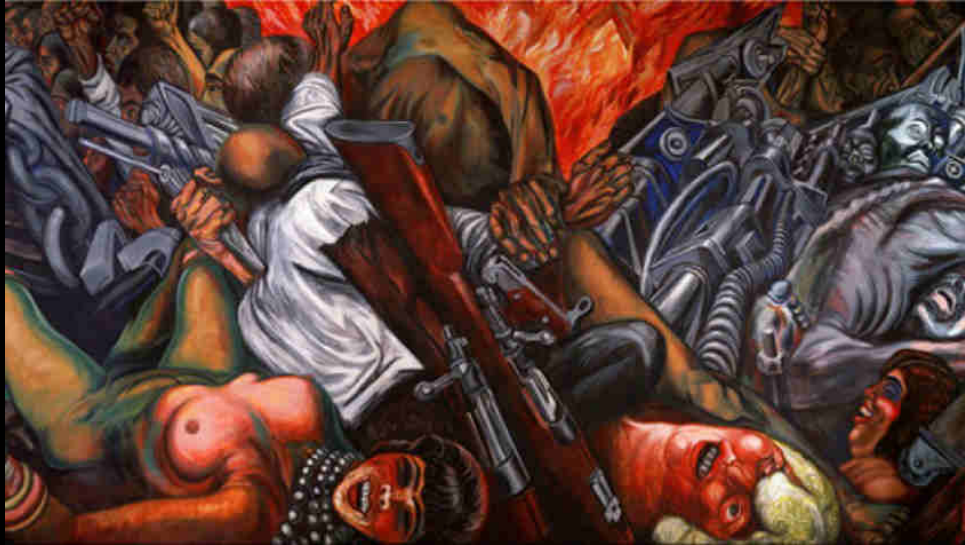
José Clemente Orozco « Katharsis », 1934, Palais des Beaux Arts de Mexico