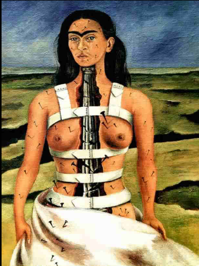
« La colonne brisée », 1944, Huile sur masonite , 39,8 cm × 30,6 cm