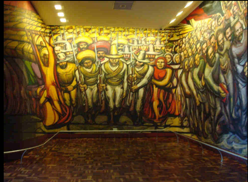
« Du porfirisme à la Révolution », David Alfaro Siqueiros, 1945, Musée nationale d'histoire de Mexico