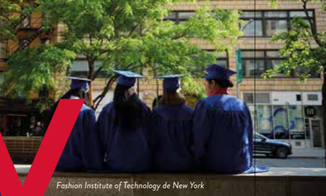
Fashion Institute of Technology de New York