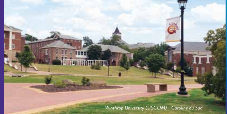
Winthrop University (USCOM) - Caroline du Sud

80+ ÉTABLISSEMENTS PARTENAIRES répartis dans 32 pays