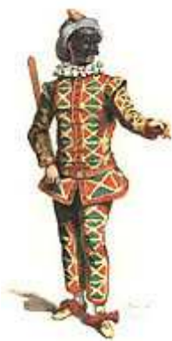
Arlequin (1671, par M. Sand)

Au début du XVIIIème siècle, sous l'influence des évolutions politiques et sociales, les valets vont adopter une nouvelle psychologie. Ils deviennent plus arrogants, sûrs de leur valeur, voire de leur supériorité.