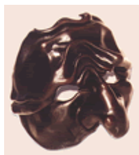
Polichinelle par Jorge Anon

Le masque noir de Polichinelle évoque la laideur sans aller jusqu'à la monstruosité. Des joues tombantes, souvent couvertes de verrues, des collines de rides sur le front, un nez aquilin, souligné parfois d'une monstache. Comme Arlequin, il arbore non pas une mais deux verrues sur le front... Verrues ou cornes du diable ?