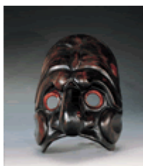
Brighella par Antonio Fava

Le masque de Brighella est assurément plus bestial et plus rusé que celui d'Arlequin. Des traits des joues et des orbites étirés vers l'extérieur, un nez aux narines larges, semblable au museau d'un singe malin, ... En ce qui concerne la couleur brune foncée, Goldoni dira qu'elle évoque la peau brûlée des habitants de ces hautes-montagnes.