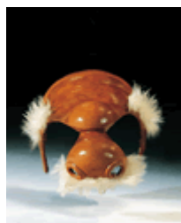
Le Docteur par Antonio Fava

S'agit-il d'un masque, ou d'un morceau de masque ? En effet, celui-ci ne couvre que le front et le nez du personnage. Les joues sont souvent peintes de couleur bordeaux... révélant l'un des vices cachés d'un Docteur biberonneur.