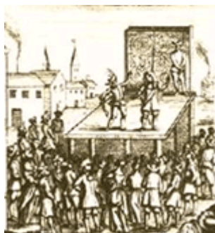
Représentation publique dans la rue