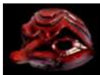
Matamore par Wendy Gough

Un masque rouge avec un long et fier nez ? Sans aucun doute, voici Matamore, le Capitaine, dont la hardiesse n'a d'égale que sa lâcheté ! Il arbore également de furieuses moustaches hérissées, "véritables chevaux de frise défendant les approches d'une citadelle trop facile à prendre" (Pierre-Louis Duchartre, La Comédie italienne (1924)).