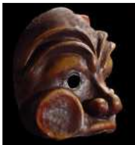
Le masque d'Arlequin par Wendy Gough