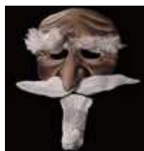
Pantalon par Wendy Gough

Ce qui fait la force du masque brun de Pantalon est sans aucun doute son nez aquilin et proéminent, tel le bec d'un rapace. Il porte, en outre, de longues et fines moustaches grises, ainsi qu'une barbe blanche allongée en pointe au menton. Ce qui produit d'ailleurs un effet comique lorsqu'il parle.