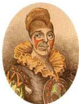
Joe Grimaldi, célèbre pantomime anglais du 19ème siècle, père du clown Moderne

Au 19ème siècle, la Commedia dell'arte disparaît littéralement de la scène. Seuls quelques écrivains y feront référence, tel Paul Verlaine dans "Les Fêtes Galantes", se disant sensibles à ces personnages, "masques et bergamasques jouant du luth et dansant".