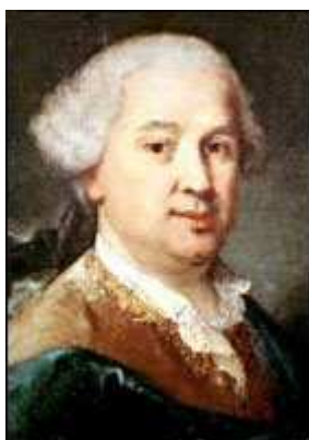
Portrait de Carlo Goldoni