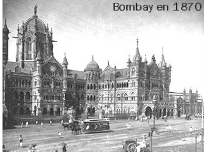
Bombay en 1870