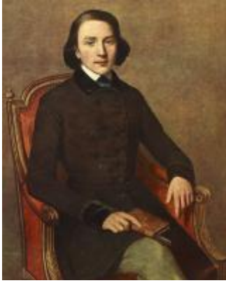
Victor Hugo vers 1829

Les deux premiers livres des Contemplations comportent de nombreuses pièces d'allure légère et populaire, écrites sur des vers courts et parfois impairs, comme dans cette « chanson ». Le Je lyrique y tourne en dérision l'adolescent qu'il a été.