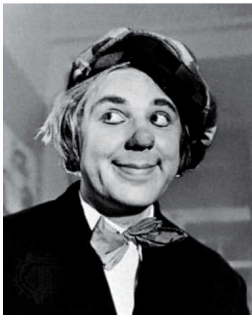
Oleg Popov, 1960