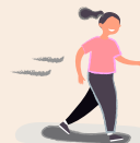
LA VITESSE DE MARCHÉ D'UN ENFANT DE 10 ANS