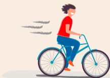
LA VITESSE D'UN ADULTE À VÉLO