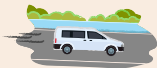
LA VITESSE D'UNE VOITURE SUR L'AUTOROUTE

La vitesse moyenne d'un monocoque est de 12 nœuds. Cela est égal à :