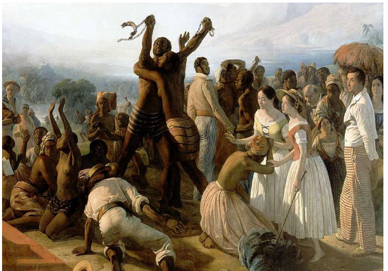
L'abolition de l'esclavage dans les colonies françaises en 1848

Devenus libres , les esclaves furent payés pour leur travail, comme les autres travailleurs, et purent choisir leur métier et leur mode de vie .