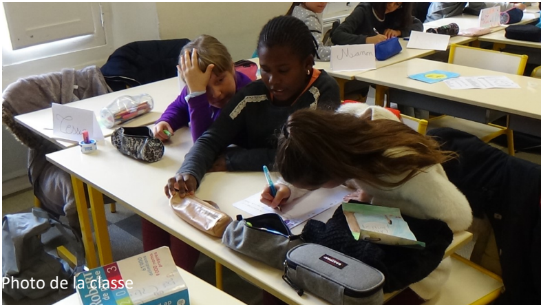
Photo de la classe