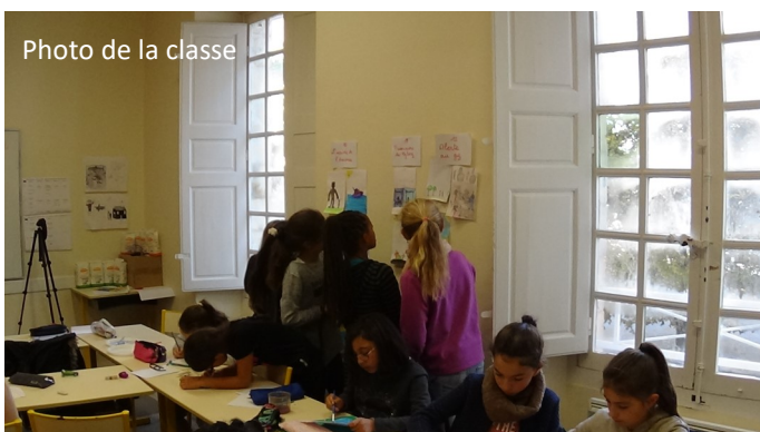
Photo de la classe

Les veillées étaient parfois « marrantes » je vais vous en raconter une :