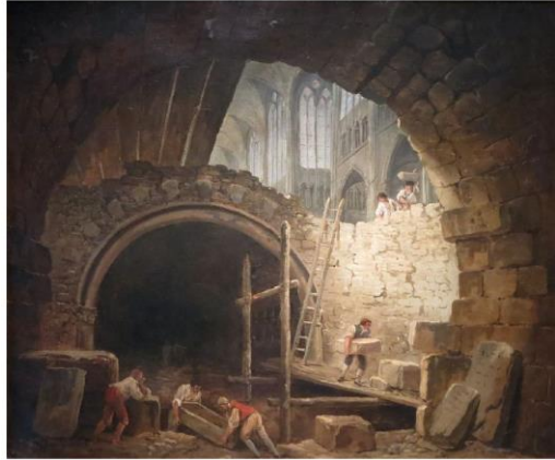
La violation des caveaux des rois dans la basilique de Saint-Denis en octobre 1793, peinture de Hubert Robert (huile sur toile, Musée Carnavalet).

La profanation des tombes royales de la basilique Saint-Denis est un épisode de la Révolution française au cours duquel les tombeaux de la nécropole royale de la basilique de Saint-Denis, ont été démontés ou détruits. Approuvées par la Convention nationale (Assemblée) en août 1793, les exhumations prennent fin en janvier 1794.