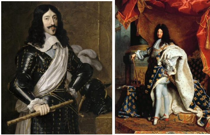
Louis XV et Louis XVI