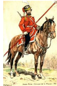
cosaque : paysan-soldat, membre de régiments spéciaux de la cavalerie russe