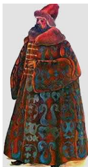
boyard : noble de haut rang dans la Russie ancienne