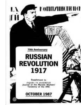
Commémoration octobre 1917