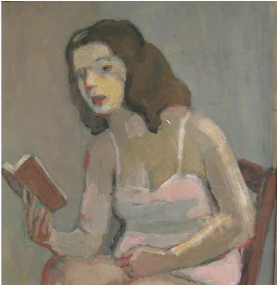
« Jeune femme lisant »