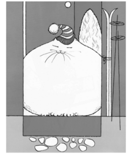
The cat from Norway