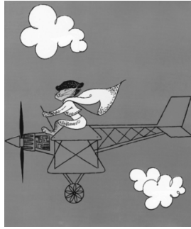
The cat from Spain