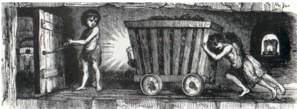
Des enfants mineurs au XIX ème siècle.

Dans les mines travaillent des enfants de 4, 5, 7 ans ; la majorité toutefois a plus de 8 ans. Ils sont employés à transporter les matériaux extraits du front de taille à la voie où passe le cheval, ou au puits principal. Le transport du charbon et du fer est un travail très dur, car il faut traîner ces matériaux dans d'assez grandes bennes sans roues, sur le sol inégal des galeries, souvent sur de la terre humide ou dans l'eau, souvent en montant des pentes raides et par des passages qui sont parfois si étroits que les travailleurs sont obligés d'aller à quatre pattes. La durée du travail est habituellement de 11 à 12 heures ; elle va jusqu'à 14 heures et, très fréquemment, on fait une double journée, si bien que l'ensemble des travailleurs reste sous terre en activité 24, assez souvent même, 36 heures à la suite. ENGELS (1848)