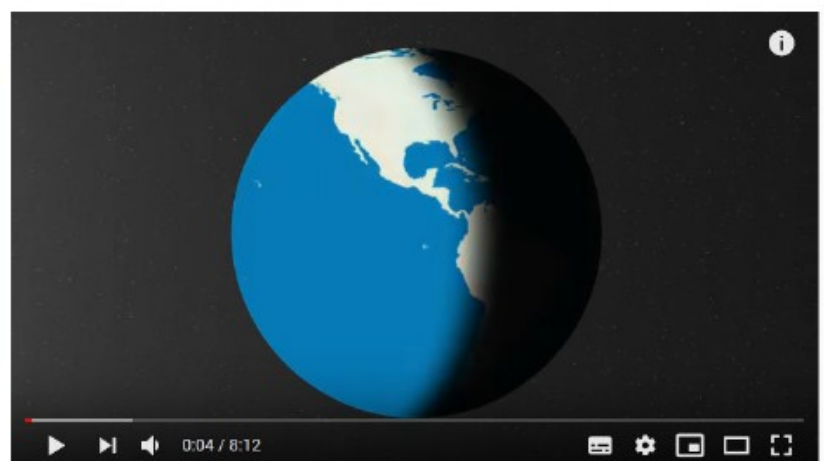
La Première Guerre mondiale - Résumé des grandes étapes de la Grande Guerre

Pour finir, regarde la vidéo ci-contre, elle reprends toutes les étapes de cette guerre, que l'on a surnommée « la Der des der » à la fin du conflit. D'après toi, qu'est-ce que cela veut dire ?