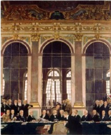
La signature du traité de Versailles (Tableau de W. Orpen, 1919)

La guerre a fait près de 10 millions de morts, dont au moins 1,5 millions de français et 6 millions de grands blessés. Les destructions matérielles sont considérables et les populations traumatisées. L'Europe est alors en déclin. Humiliée par le traité de Versailles, l'Allemagne souhaite prendre sa revanche sur les Alliés.