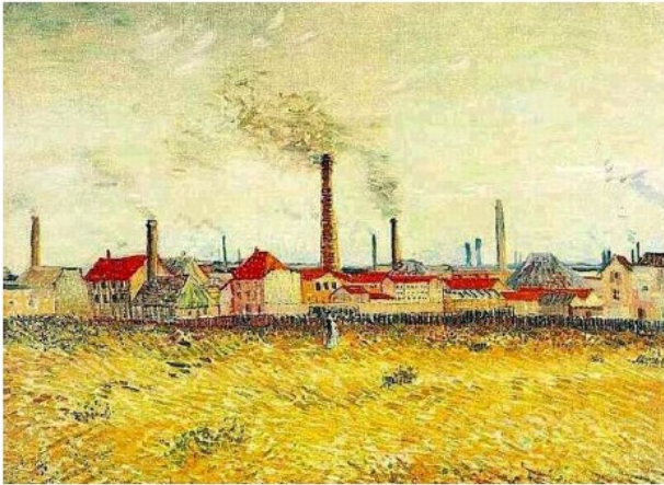
Document 1 : Usines à Asnières, Vincent Van Gogh, 1887

Les progrès techniques bouleversent les modes de production.