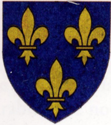
Blason des Capétiens, les rois de France.