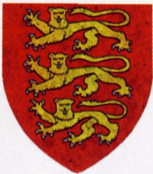
Blason des rois d'Angleterre.