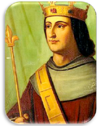
Philippe VI de France

A qui va revenir la couronne de France ?