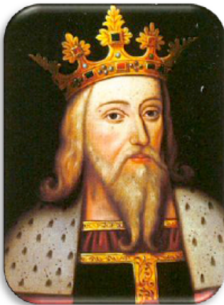
Edouard III d'Angleterre

En 1328 Charles IV, dernier fils du roi Philippe Le Bel, meurt. Il n'a pas lui-même de fils. Les héritiers sont donc son neveu, Philippe de Valois et son petit-fils, Edouard III d'Angleterre.