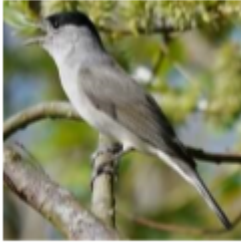
Fauvette à tête noire