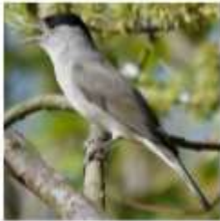
Fauvette à tête noire