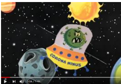
Corona Minus d'Aldebert.

Voilà ! C'est fini pour aujourd'hui. On se retrouve jeudi ! Bonne journée ! Je t'embrasse !