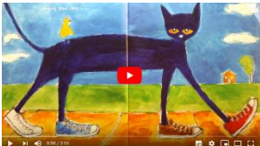
Pete the cat !