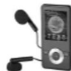
Lecteur MP3 ④