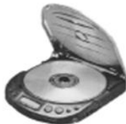
Lecteur CD ③