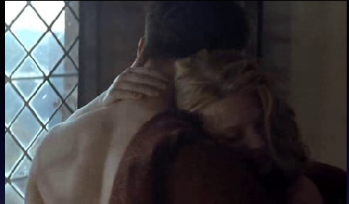
Champ : l'étreinte entre les deux époux.