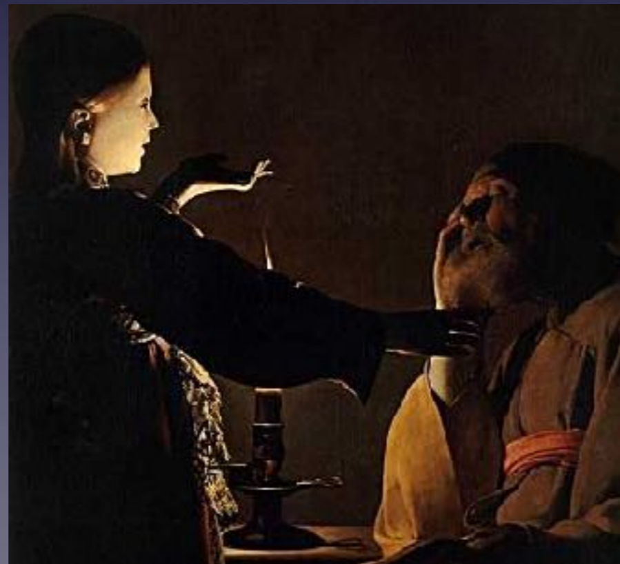
Georges de La Tour, Le Rêve de St Joseph , vers 1630.