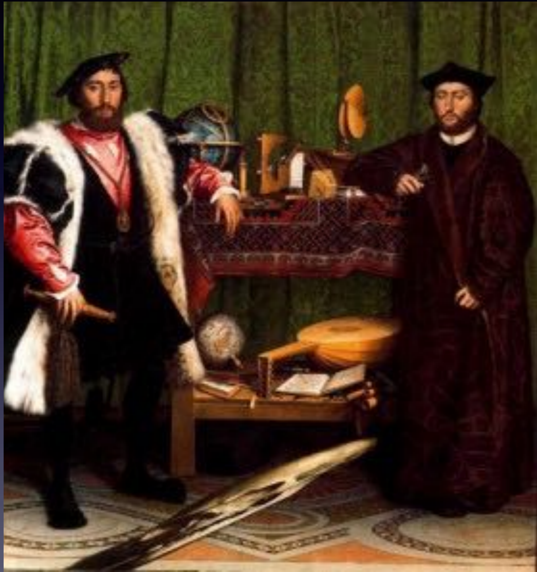
Les Ambassadeurs d'Holbein, 1533.