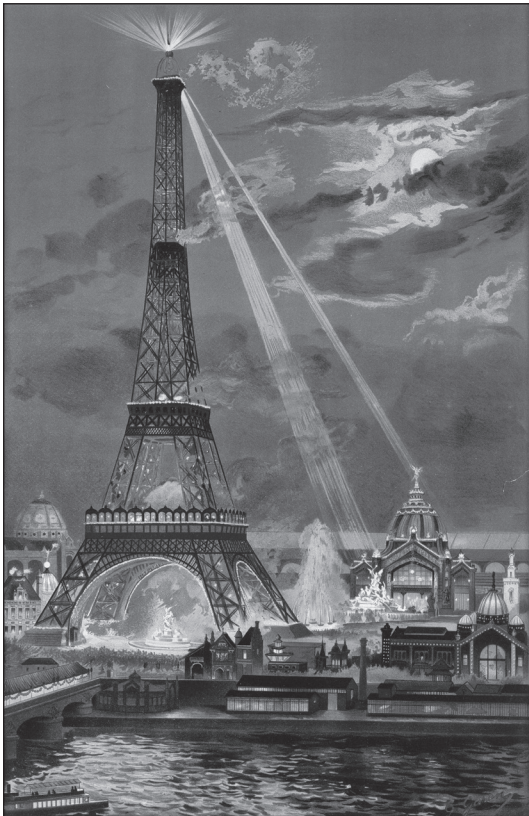
Doc. 1 La tour Eiffel lors de l'Exposition universelle de 1889. Estampe, 1889.