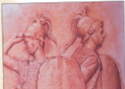
Deux soldats protégés par leur

Ils peuvent rejoindre l'armée s'ils le souhaitent quand un nouvel ennemi se présente, ou alors finir tranquillement leur vie, se marier et avoir des enfants. Fiers d'avoir servi l'empire de Rome, ils obtiennent une place respectée dans la société. ■