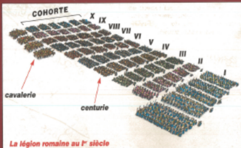
La légion romaine au I er siècle

À chaque légion est rattaché un groupe de 120 cavaliers (équites) qui servent d' éclairateurs . L'armée de l'empereur Auguste compte, au début du I er siècle, 23 légions. Au temps de Marc-Aurèle (au II e siècle), il y en a 30.