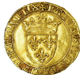
Monnaie d'or sous le règne de Louis IX

Il créa une monnaie unique valable dans tout le royaume.