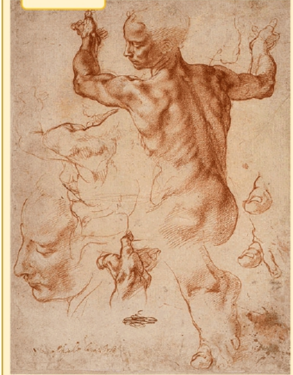
Etude de Michel-Ange