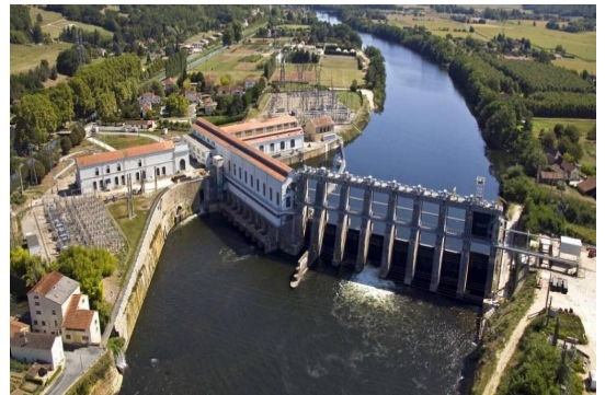
Centrale hydroélectrique en France

Les centrales hydroélectriques sont des barrages construits sur des rivières ou des fleuves. Un système permet de produire de l'électricité grâce à la force de l'eau qui descend, en créant une chute d'eau.