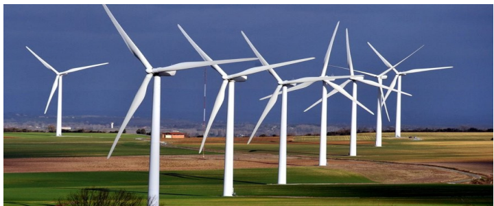
Parc éolien dans la Beauce en France

Les éoliennes Une éolienne est une machine qui utilise la force du vent pour produire de l'électricité : le vent fait tourner les pales pour produire l'énergie. En France, on trouve de plus en plus de champs d'éoliennes.