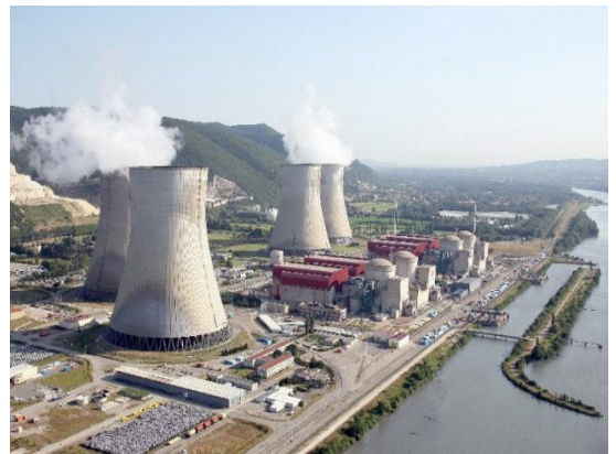
Centrale nucléaire du Tricastin France

Une centrale nucléaire produit de l'électricité grâce à des explosions d'uranium. Elle a donc besoin de minerai d'uranium pour fonctionner. Elle ne rejette pas de gaz polluant dans l'atmosphère, mais de la vapeur d'eau. Elle produit des déchets radioactifs très dangereux, que les hommes ne savent pas trop comment stocker. Pour refroidir ses circuits, elle utilise l'eau des rivières qu'elle rejette ensuite : cela réchauffe la rivière et perturbe la nature.