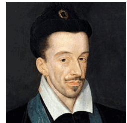
Henri III 1574-1589