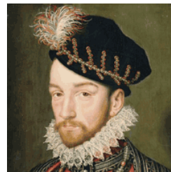
Charles IX 1560-1574