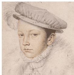
François II 1559-1560