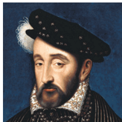
Henri II 1547-1559