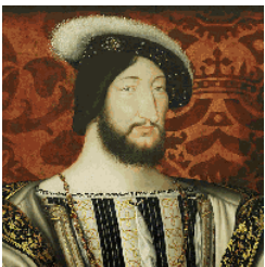
François 1 er 1515-1547