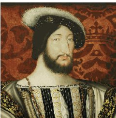
François 1 er

5 Classe les monarques suivants dans l'ordre chronologique en indiquant leur nom?