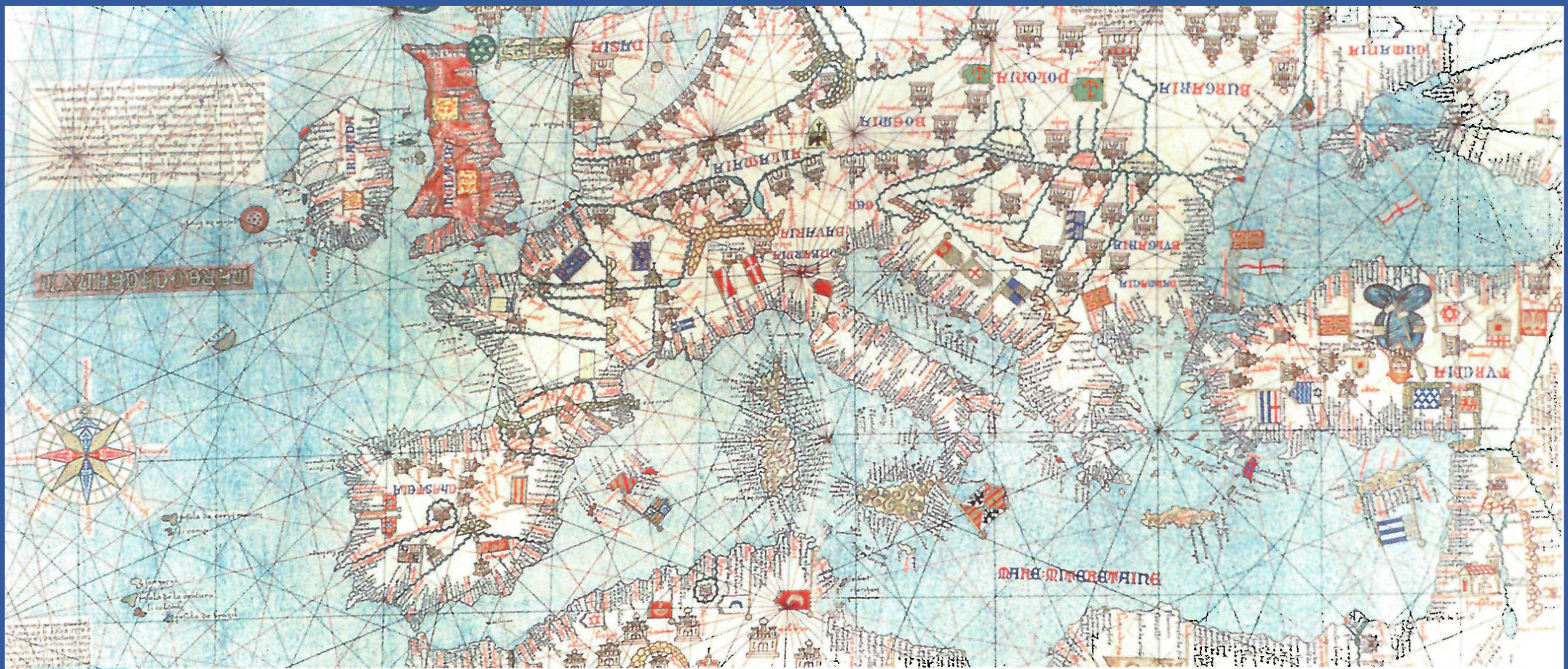
Doc 4 Un exemple de portulan du XIV e siècle