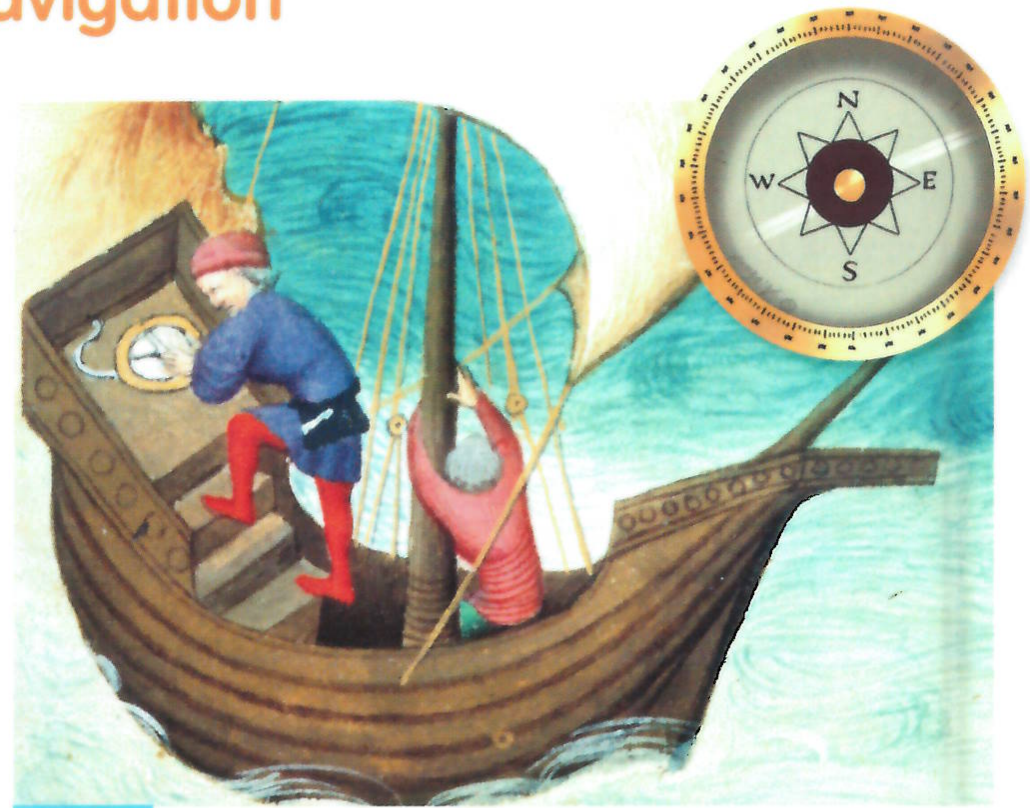
Doc 3 La navigation à la boussole au XIV e siècle

À cette époque, les marins naviguent à proximité des côtes. En notant leurs observations et en faisant des relevés à l'aide de ces nouveaux instruments, ils établissent les premières cartes de navigation, appelées « portulans ». Elles leur permettent de se repérer et de naviguer en sécurité.