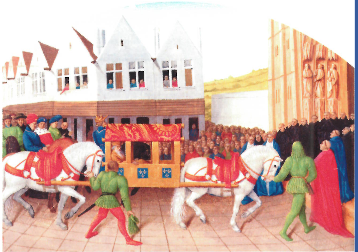
Doc 1 Un déplacement en litière

Au Moyen Âge, la plupart des gens effectuent des trajets à pied. Les plus fortunés (nobles, commerçants, prêtres) se déplacent régulièrement à dos de cheval, et parfois en charriot ou sur une litière portée par des chevaux.