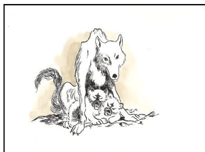
La maman : la louve