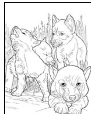
Les petits : les louveteaux