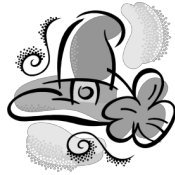
un grand chapeau N masc. sing.