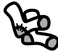
des grandes chaussettes N fém. pl.

Écris les phrases au pluriel. Attention aux accords !