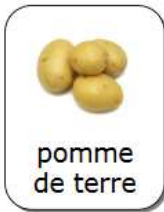
pomme de terre