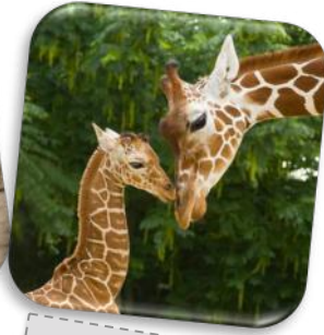
... ou girafeau