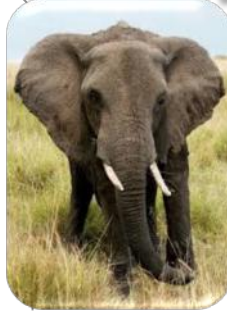
Les défenses et la trompe