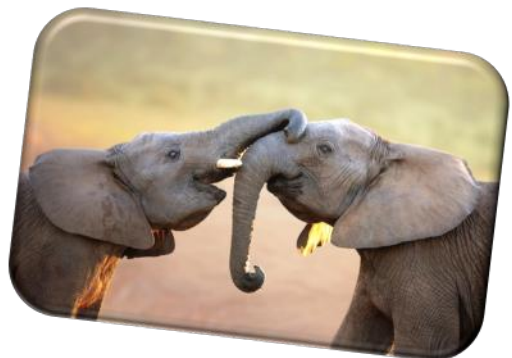
L'éléphant barrit !