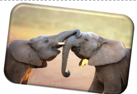
L'éléphant barrit !