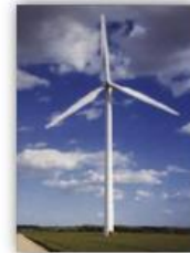
Panneaux solaires, éolienne